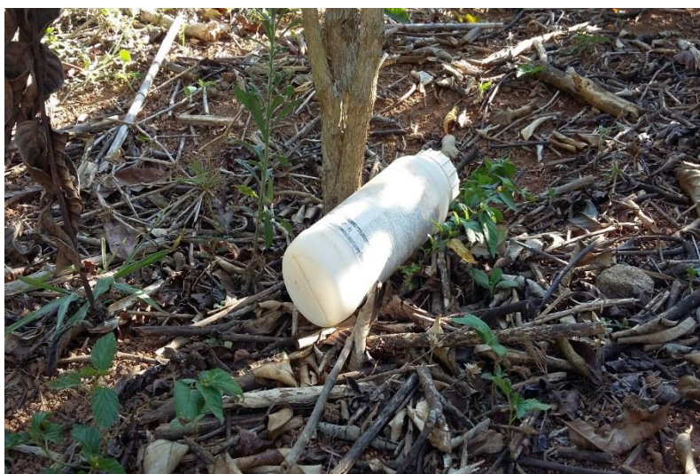
Figura 2. Embalagem vazia de agrotóxico descartada na lavoura.

Para recebimento das embalagens vazias de agrotóxicos o município conta desde 2002 com a Associação dos Comerciantes e Consumidores de Defensivos Agrícolas da Região de Caratinga (ACCODEF), mas conforme evidenciado na pesquisa, 88% dos entrevistados não efetuam a destinação ambientalmente correta de embalagens vazias de agrotóxicos, assim como, 63% relataram utilizar as mesmas para outras finalidades como para armazenamento de gasolina, óleo diesel, óleo queimado e para o transporte de água para lavoura para preparo da calda. Quando não utilizados para esta finalidade, as mesmas são queimadas, largadas na lavoura ou armazenadas na tulha, conforme evidenciado na Figura 2.