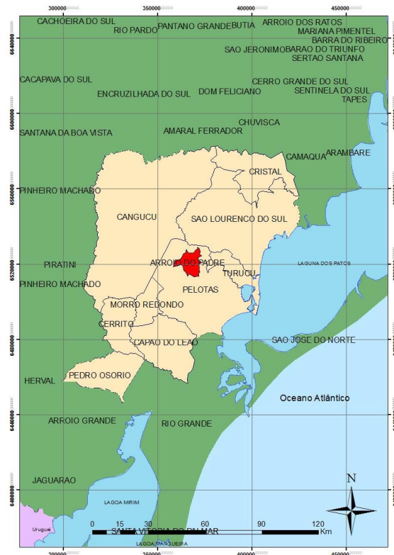
Figura 1: Localização do município de Arroio do Padre.

O município não possui concessão pública para fazer a prestação do serviço de abastecimento de água, desta forma, a responsabilidade pelo fornecimento de água, obras e serviços necessários ficam a cargo do município. O SEMAAP (serviço municipal de abastecimento de água de Arroio do Padre) foi criado em 2005.