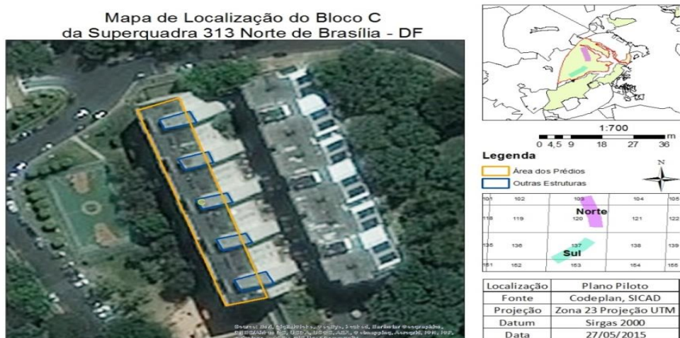
Figura 3- Mapa de Localização do bloco C da Quadra 313 Norte.