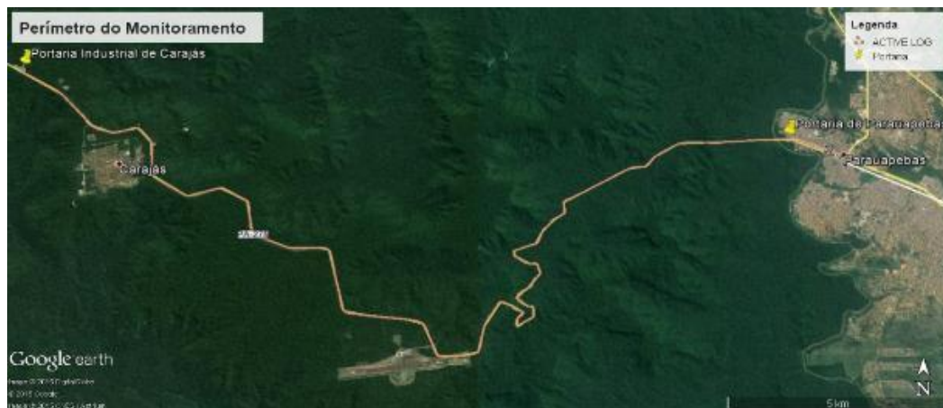
Figura 01: Adaptado do Google Earth (2015)

O método de coleta de dados escolhido foi o da observação, onde o perímetro compreendido entre a portaria da unidade no município de Parauapebas – PA e a portaria de N5 no complexo mineral de Carajás, foi monitorado por 10 dias ao longo de 40 vistorias realizadas com veículo automotor circulando com velocidade aproximada de 60 km/h, por meio do qual realizou – se o monitoramento criterioso, considerando além da pista, as margens e canaletas de águas pluviais existentes. Os horários foram escolhidos de acordo com o pico de trânsito informado pela segurança patrimonial da empresa Vale S.A, responsável por controlar o acesso, tendo ocorrido vistorias nos períodos diurnos e noturnos, como visto na figura 02.