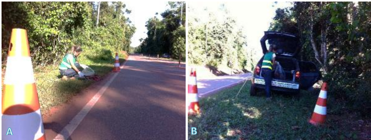
Figura 03: A. Coleta de Material Biológico B. Acondicionamento para transporte.

A identificação dos animais encontrados foi realizada com o apoio de uma equipe multidisciplinar do ICMBio e Parque Zoobotânico Vale em Carajás, contando ainda com um vasto acervo bibliográfico da região, que possibilitou a correta identificação das espécies, a exemplo do livro “Fauna da Floresta Nacional de Carajás: Estudos sobre Vertebrados Terrestres”, que contribuiu sobremaneira na identificação. O material biológico coletado durante a realização da pesquisa foi disposto em saco plástico, etiquetado in loco e transportado no veículo de apoio da equipe até a sede do ICMBio em Parauapebas, sendo a partir de então, definidas as destinações adequadas para cada caso, em conformidade com as autorizações recebidas. Alguns táxons foram doados para instituições com fins de educação ambiental e outros destinados ao Parque Zoobotânico, onde as carcaças foram destinadas de acordo ao plano de gerenciamento de resíduos estabelecido no local.