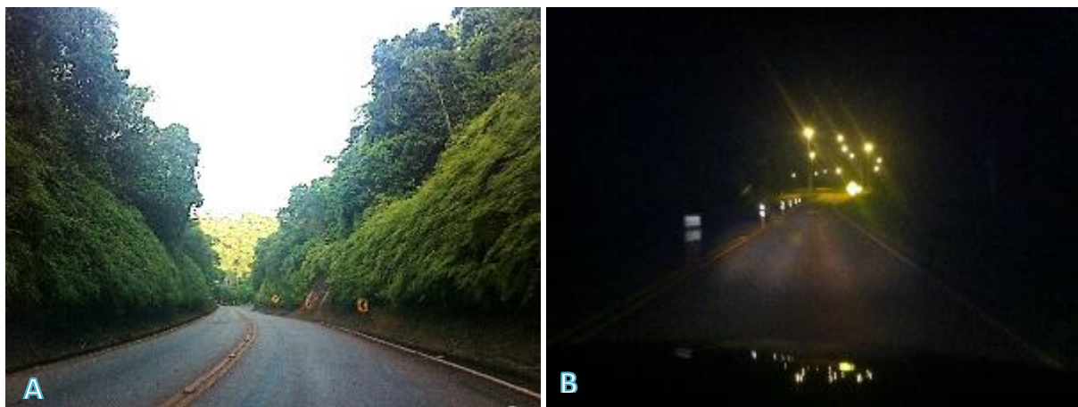
Figura 02: A e B: Ilustrações da visibilidade diurna e noturna na estrada.

O método de coleta de dados escolhido foi o da observação, onde o perímetro compreendido entre a portaria da unidade no município de Parauapebas – PA e a portaria de N5 no complexo mineral de Carajás, foi monitorado por 10 dias ao longo de 40 vistorias realizadas com veículo automotor circulando com velocidade aproximada de 60 km/h, por meio do qual realizou – se o monitoramento criterioso, considerando além da pista, as margens e canaletas de águas pluviais existentes. Os horários foram escolhidos de acordo com o pico de trânsito informado pela segurança patrimonial da empresa Vale S.A, responsável por controlar o acesso, tendo ocorrido vistorias nos períodos diurnos e noturnos, como visto na figura 02.