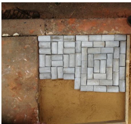
Figura 5 – Calçada produzida com os tijolos de resíduo:EVA.