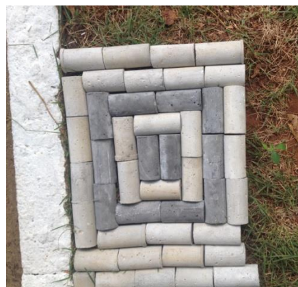
Figura 6 – Calçada produzida com os tijolos de resíduo:EVA e de areia de fundição.