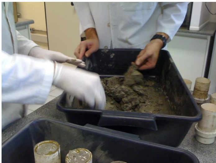
Figura 2 – Preenchimento dos moldes com argamassa.

que estão devidamente untados com óleo vegetal para facilitar no momento da desmoldagem. É necessário, para a homogeneização da argamassa, que o molde seja preenchido até a metade e façamos 6 furos na argamassa, com algum objeto cilíndrico, como um pincel, e depois bater na base do molde até os furos desaparecerem, e depois terminar de preencher o molde e repetir o procedimento de homogeneização.