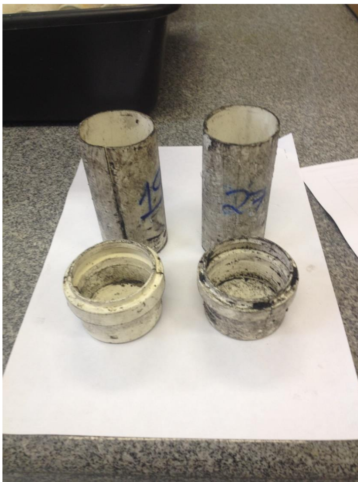
Figura 1 – Moldes para argamassa feitos de PVC e base constituída de CAPS.